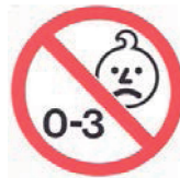
图 A.1 年龄警告的图标

对 36 个月以下儿童可能构成危险的玩具应附警告,例如:“警告:不适合 36 个月以下儿童使用”或“警告:不适合 3 岁以下儿童使用”或采用图 A.1 图标。